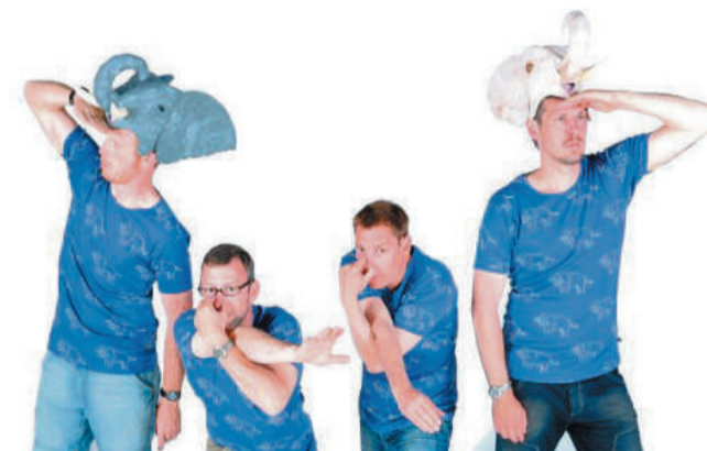
■ Naturamas husorkster "Dyr i drift" underholder i Brenderup Lørdag formiddag.

Læs mere om Landsbypuljen på www.mitfyn.dk