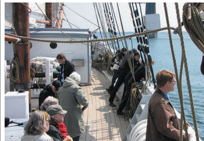
■ Lions Club i Middelfart inviterer igen i år på bølgen blå med den kendte skonnert Fulton. Arkivfoto